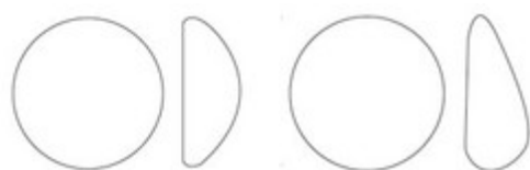
Form eines runden Implantats